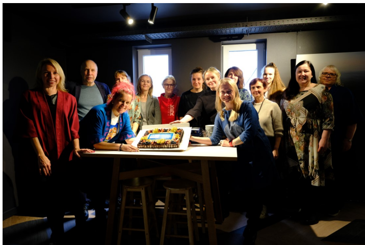
Lääne-Eesti saarte turismispetsialistid UNESCO biosfääriala 36. sünnipäeva tähistamas.

27. märtsil tähistas Lääne-Eesti saarte biosfääriala oma 36. sünnipäeva. 1990. aastal liitusid Saaremaa, Hiiumaa, Muhu, Vormsi ja Ruhnu UNESCO programmiga „Inimene ja biosfäär“, millega tunnustati siinset tasakaalu looduse ja inimtegevuse vahel.