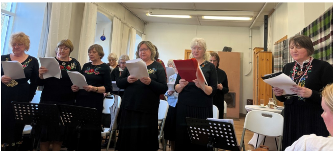
Keskmõnupidajad ja ansambel Uijee esitasid konkursile saadetud ühetähejuttusid.