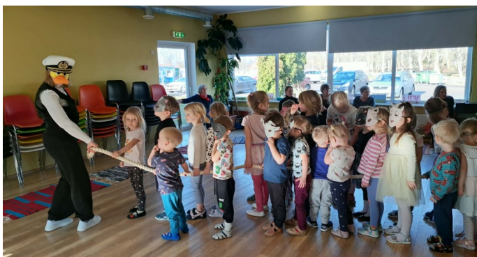
Hetk Rongisõidu raamatu tutvustamisest.

Kui "meie ajal" oli märtsikuu suurim tähtpäev naistepäev, mil iga laps joonistas emale või vanaemale kaardi, millel kindlasti oli peal eriti hoolsalt kirjutatud number 8, siis tänasel päeval on tähistamised hoopis teised. Suurema tähelepanu all on meie kaunis emakeel. Tõesti kaunis ja igati hoidmist väärt! Meie lasteaias on sel päeval traditsiooniline luulehommik. Iga