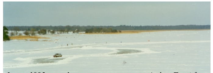
Jäätee 1995. aastal.

aastal oli talv varajane, aga detsembri alguses veel jää piisavalt paks ei olnud. Kuigi