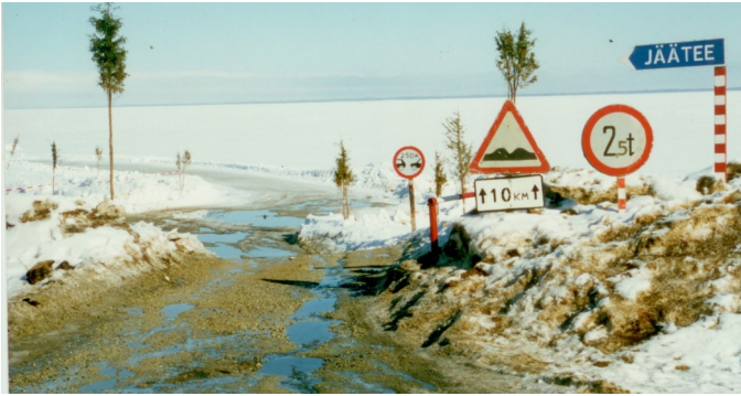
Kuivastu-Virtsu jäätee algus 1996. aastal.