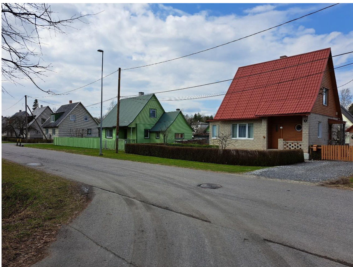
Foto 1. Rahu tänav 7.