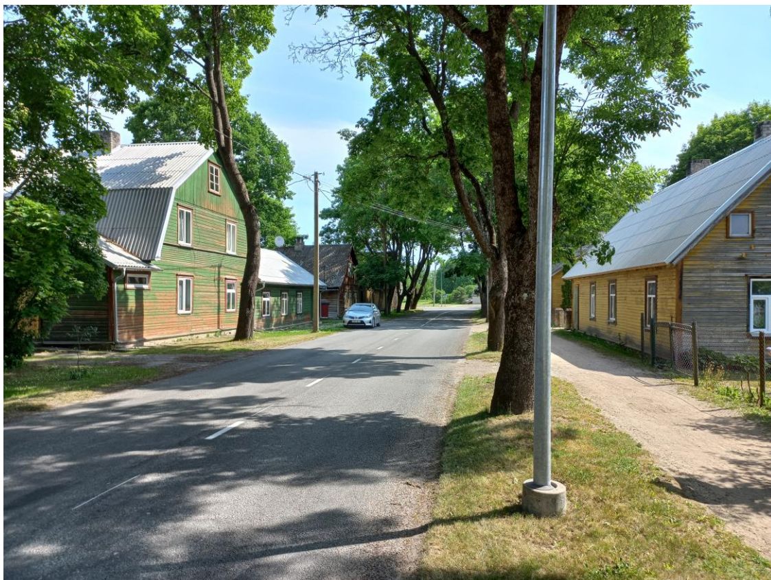
Foto 17. Soo ja Laia tänava ansambel aastal 2023.