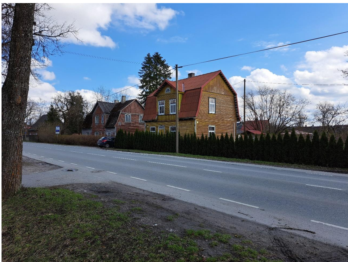
Foto 6. Pärnu tn 98 ja 100.