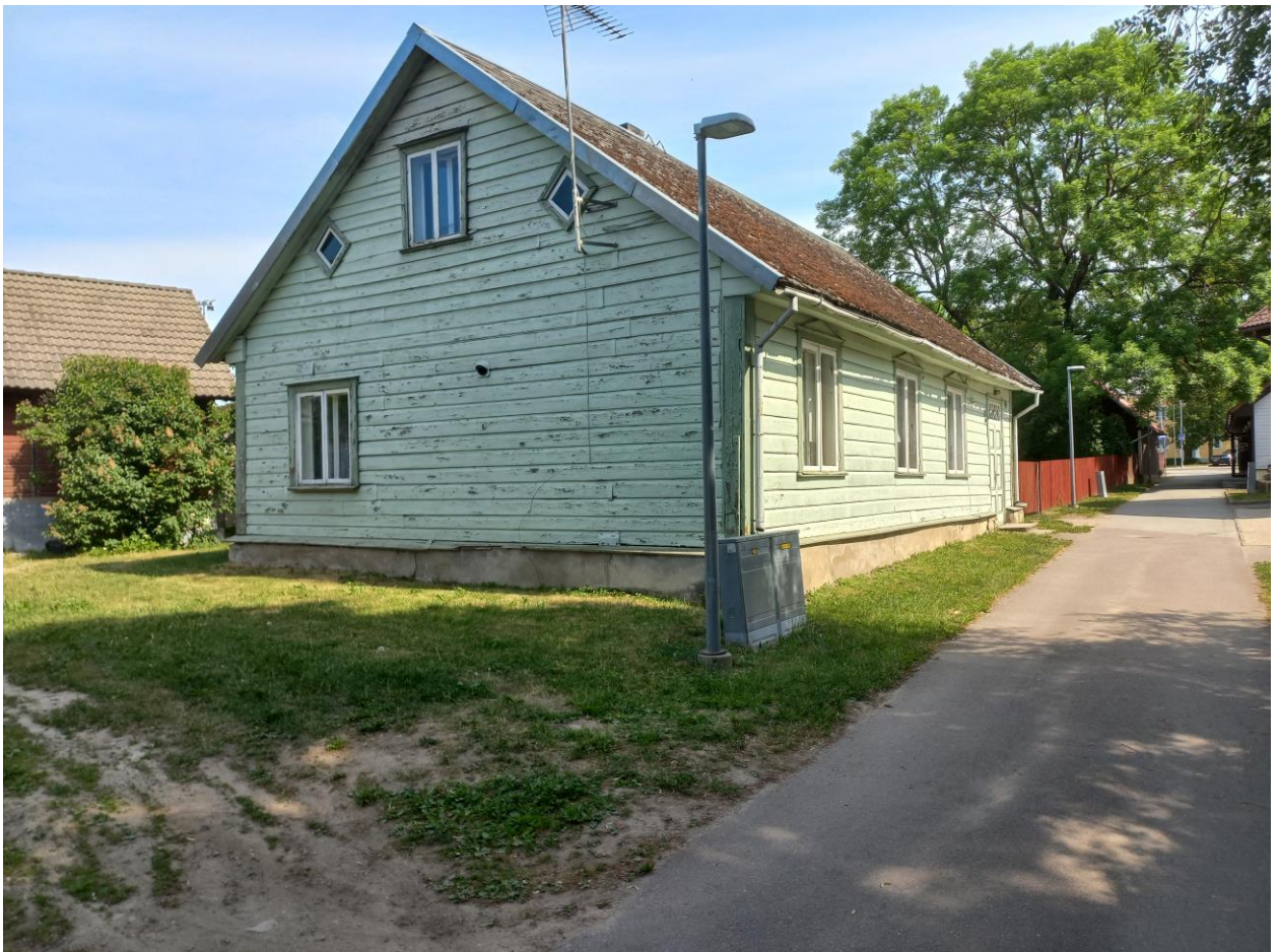
Foto 18. Põllu tn 3 hoone aastal 2023.