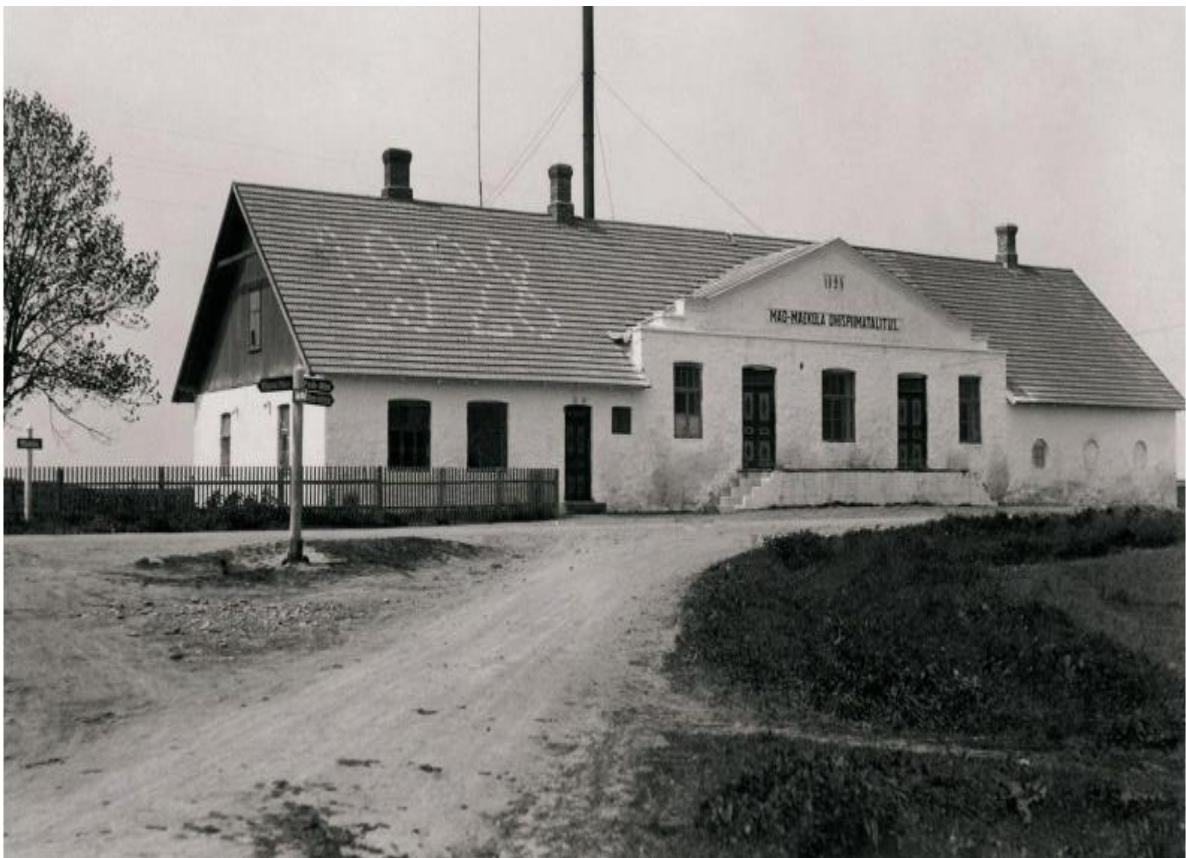
Foto 19. Mäeküla meierei.

Mäeküla meierei on arvatavalt ehitatud 1928. aastal. Hoone on paekivist kandeseintega, puitsarikate/toolvärgiga, kahekorruseline, põhimahus riskülikukujulise põhiplaaniga (foto 19). Vahelaed on ehitatud puitaladel ja terastala/betoon komposiidina. Hoonel on edela ja loode küljel ühekorruselised väljaehitused - katlamaja ja tuulekoja. Maanteepool on hoone fassaadil paekivist müür ning kõrgem platvorm. Algsel peasissepääsul on frontoon karniisiga, millele on kirjutatud „1928 Mäeküla piimatööstus“ (allikas: 2023. aastal koostatud ehitusprojekt).