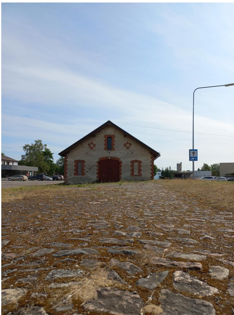
Foto 23. Raudtee ait aastal 2023.