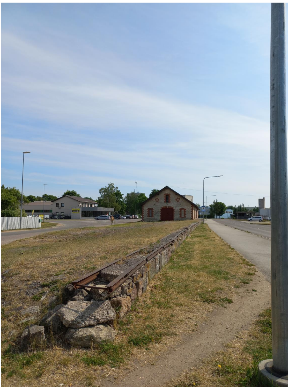
Foto 24. Raudtee ait aastal 2023.