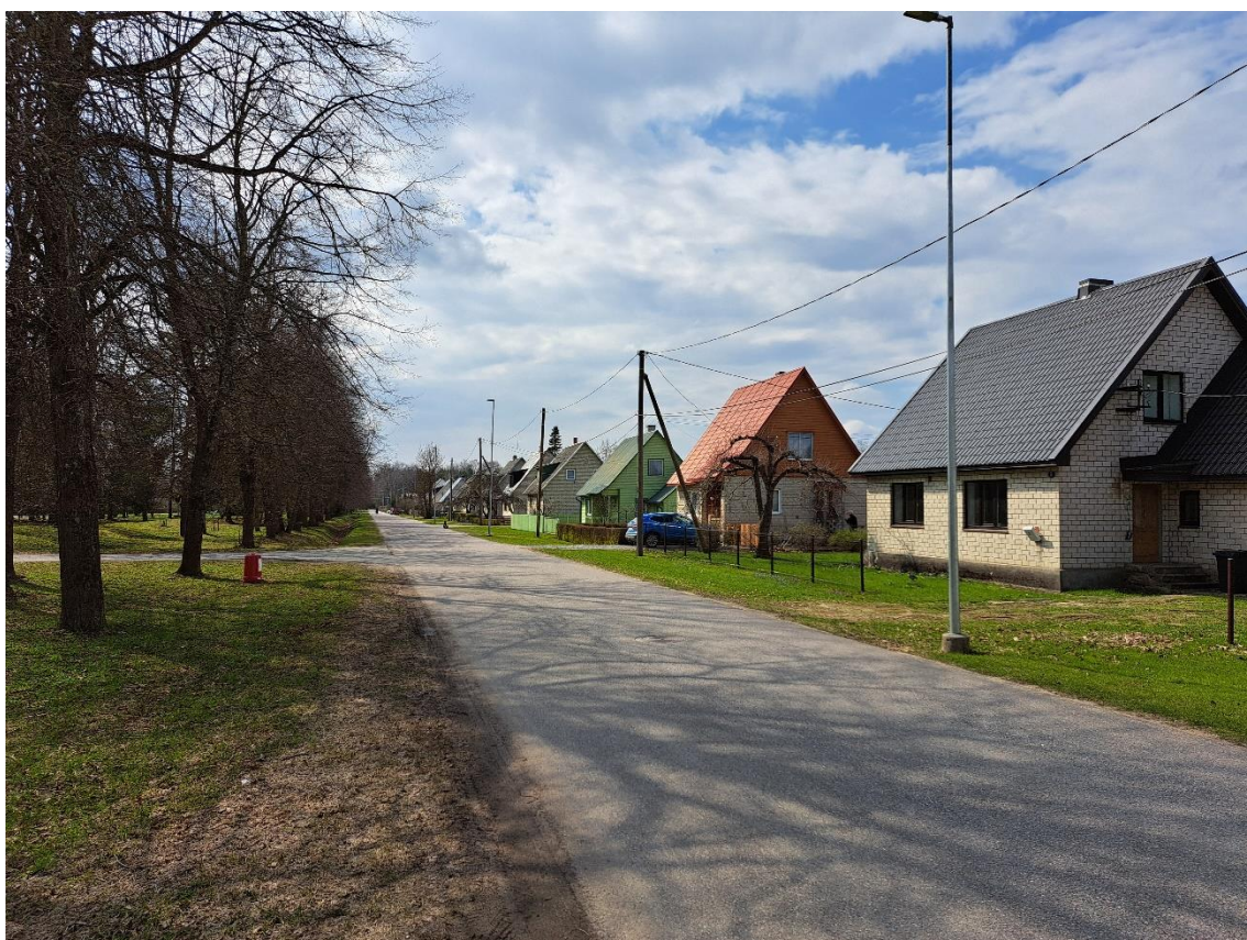
Foto 2. Rahu tänava katusemaastik.