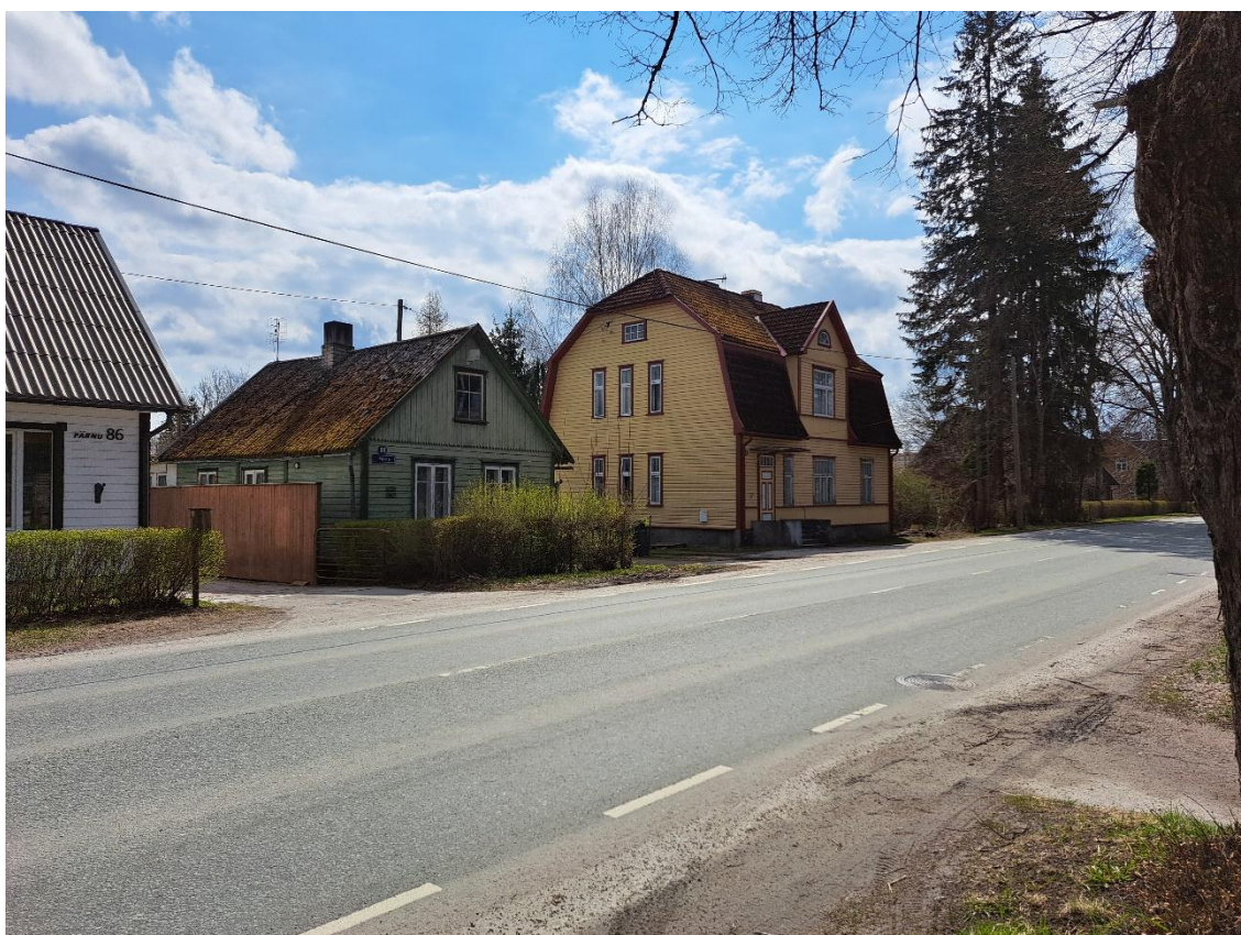
Foto 10. Pärnu tn 88 ja 90.