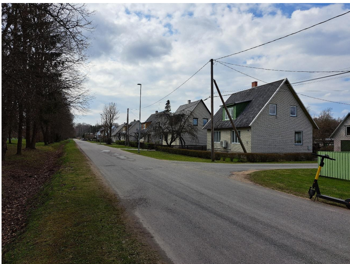
Foto 3. Rahu tänava katusemaastik ja üleminek haljasalale.