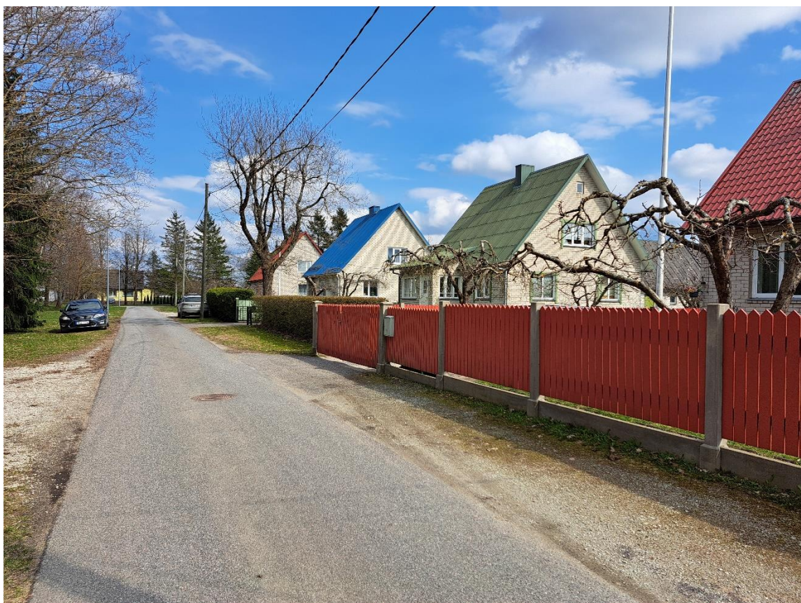
Foto 4. Rahu tänava värvikas katusemaastik.