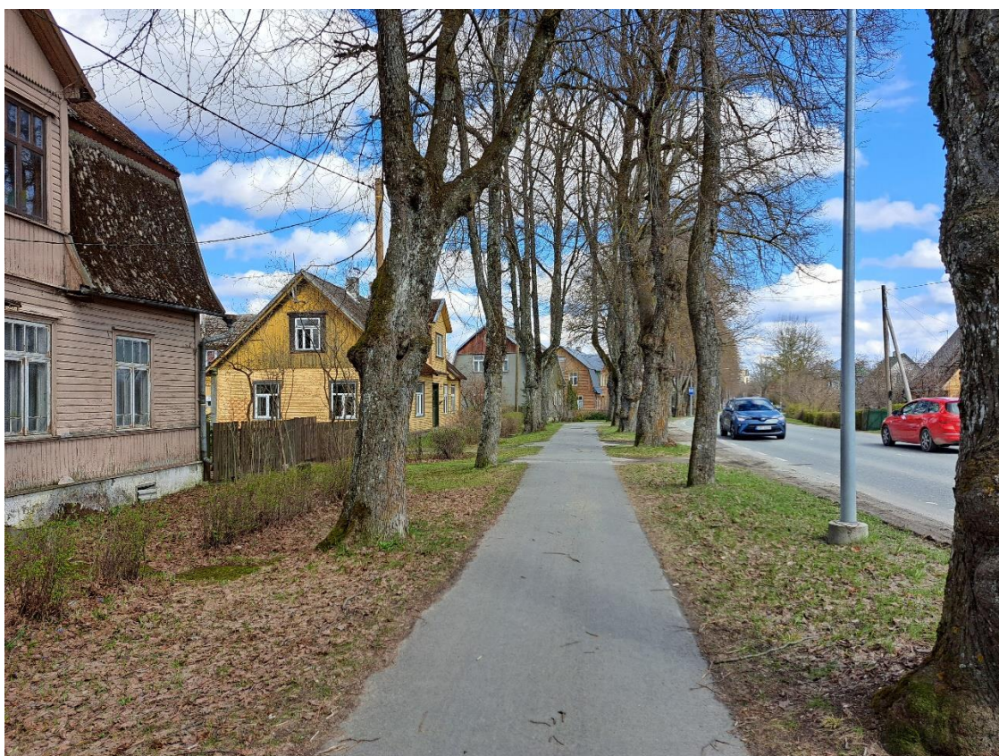
Foto 8. Pärnu tänava hoonetuslaad.