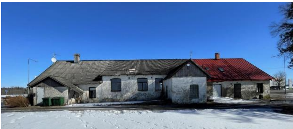
Foto 21. Olemasolev vaade Mäeküla meiereile edelast.