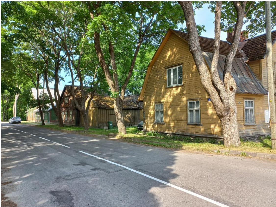
Foto 16. Soo ja Laia tänava ansambel aastal 2023.

Miljööväärtuslikkus Soo tänava ja Laia tänava hoonete puhul on terviklik ansambel (fotod 16 ja 17), mis esindab ajastukohast arhitektuuristiili (sarnase hoonestuslaad, vahelduv mansard ja viilkatus, sarnased katusekalded) ning hoonestustihedusega ning ehitusjoon tänava suhtes. Üksikutena hooneid vaadates leidub sarnase stiiliga hooneid Paides ka mujal. Lai tn 21a hoone jääb antud ansamblist veidi eemale ja puude varju, samuti ei jälgi sarnast hoonestusjoont võrreldes Soo tänava poole jäävate hoonetega.