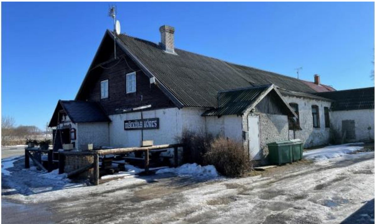
Foto 22. Olemasolev vaade Mäeküla meiereile loodest.