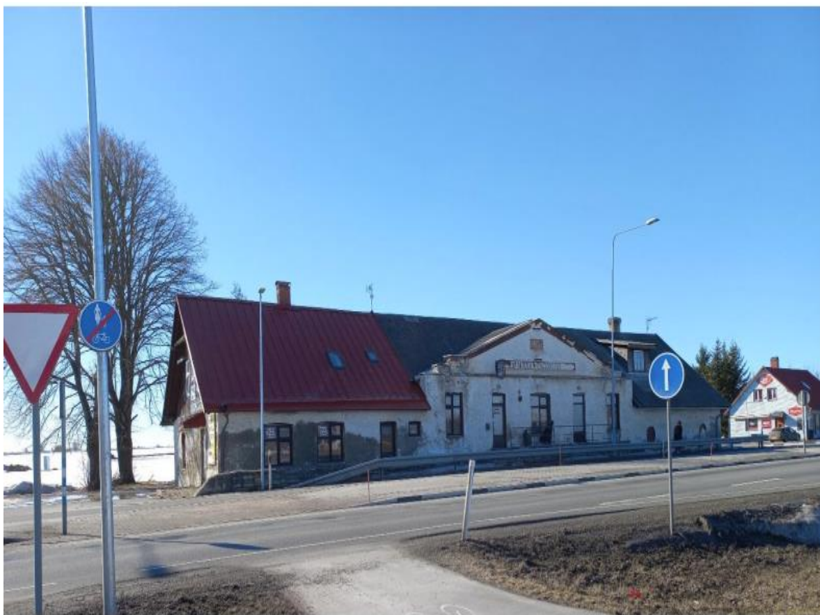
Foto 20. Olemasolev vaade Mäeküla meiereile kagust.