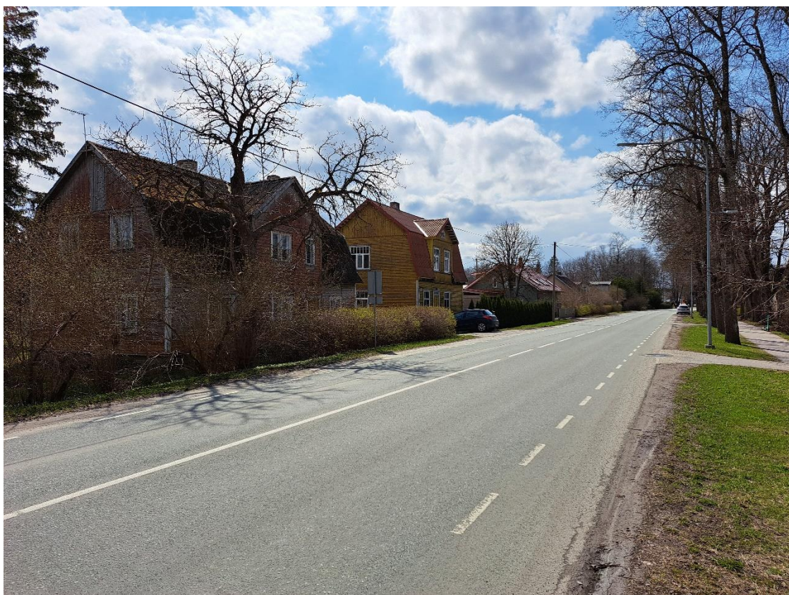
Foto 9. Vaade Pärnu tänavale.