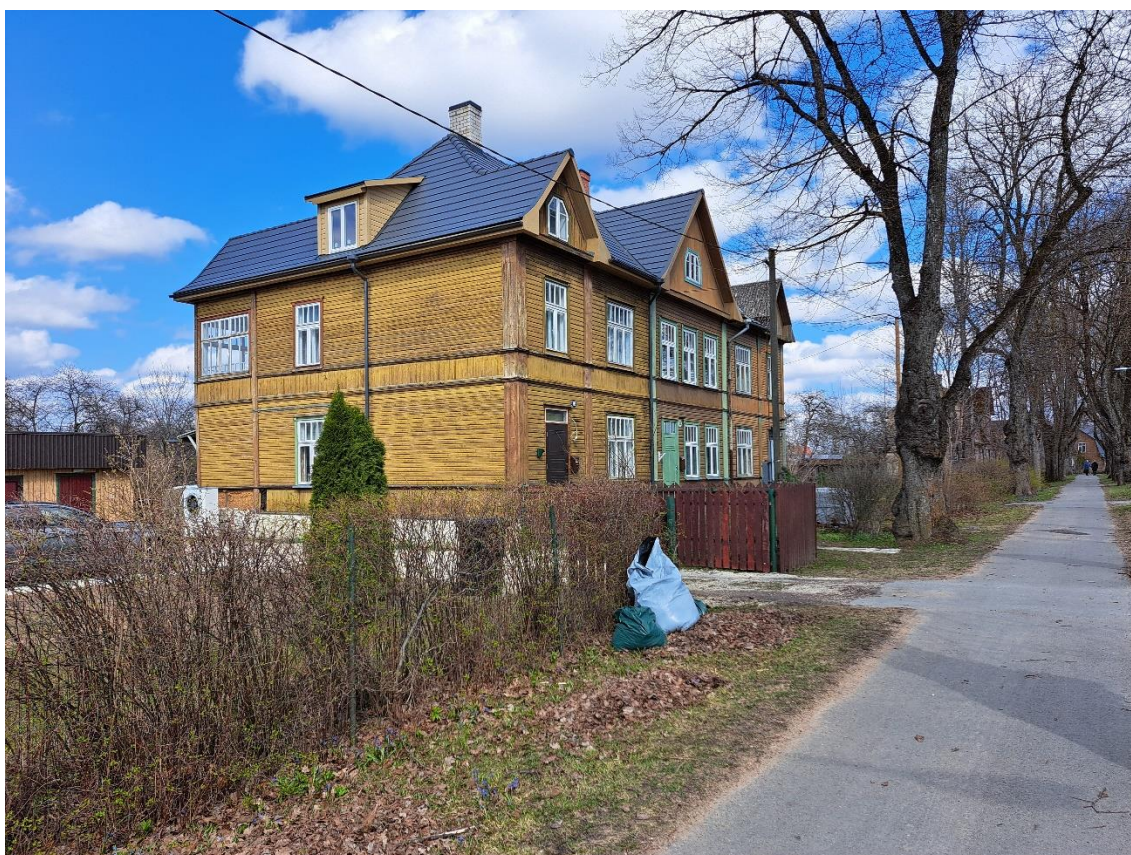
Foto 12. Pärnu tn 91, 93 ja 95.