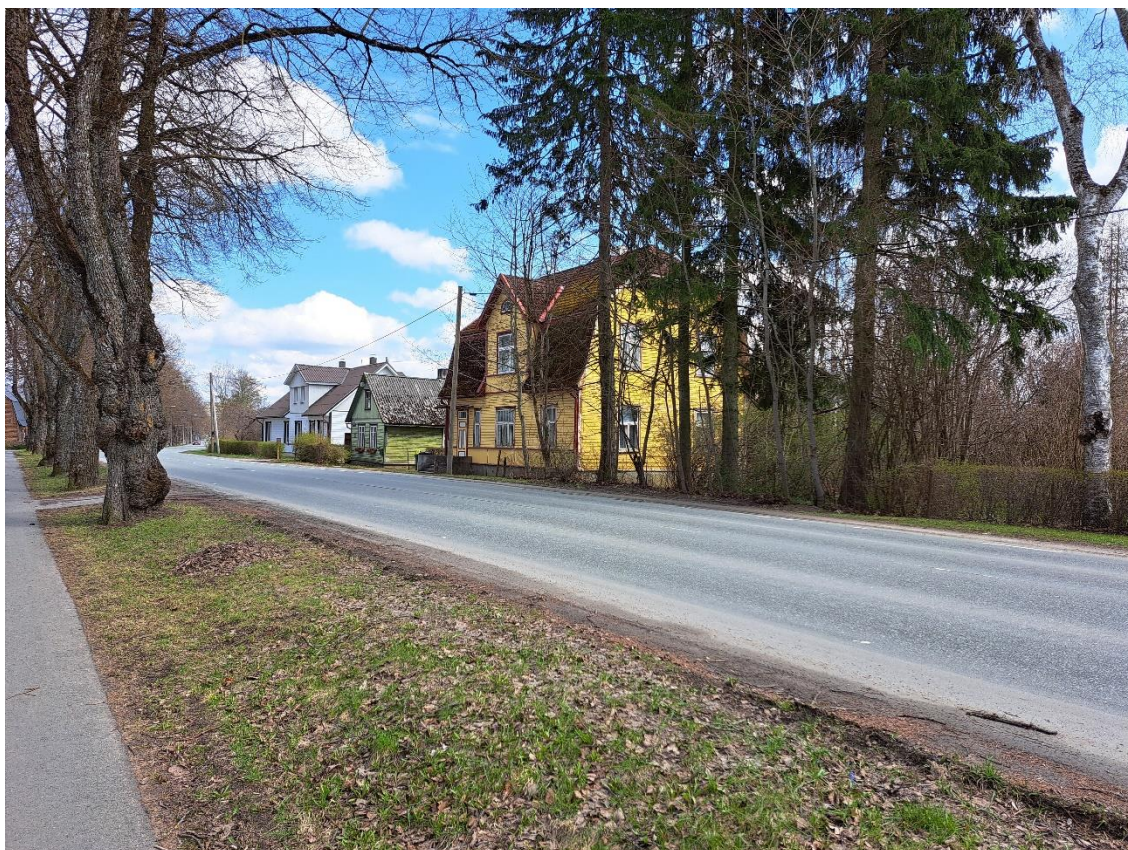
Foto 7. Pärnu tänav värvide kooslus.