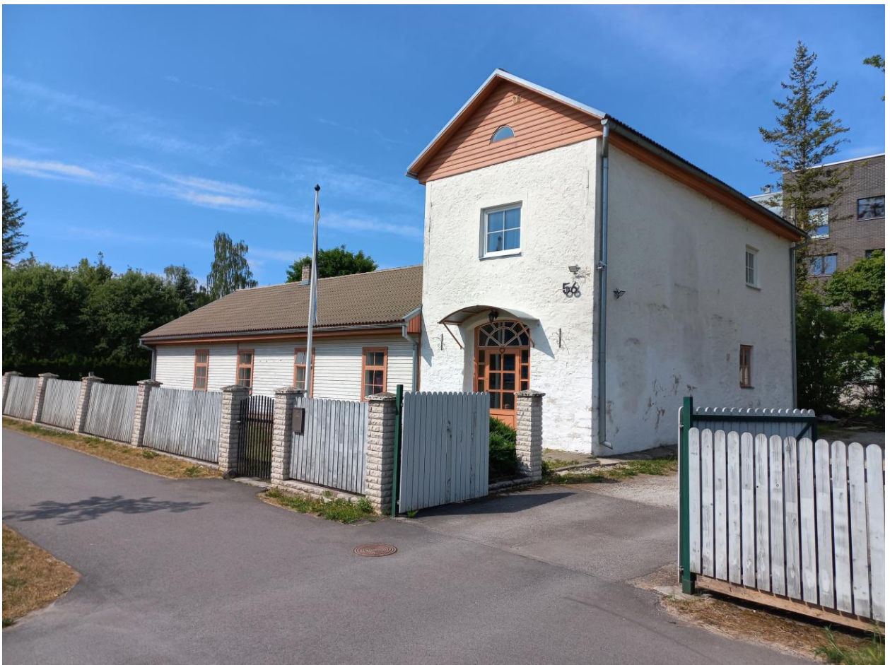
Foto 25. Tallinna tn 56 hoone aastal 2023.

Tüüpiline viilkatusega vanalinna hoone (foto 25). Koosneb kahest mahust, millest kõrgem osa on tõenäoliselt kivist. Ümbritseva keskkonna suhtes pigem üksik, kuna külgnevad kinnistud on tühjad ning taustal asub JKHK, mis enda mahuga Tallinna tn 56 hoone hoonestuslaadi asukohas võõraks muudab.